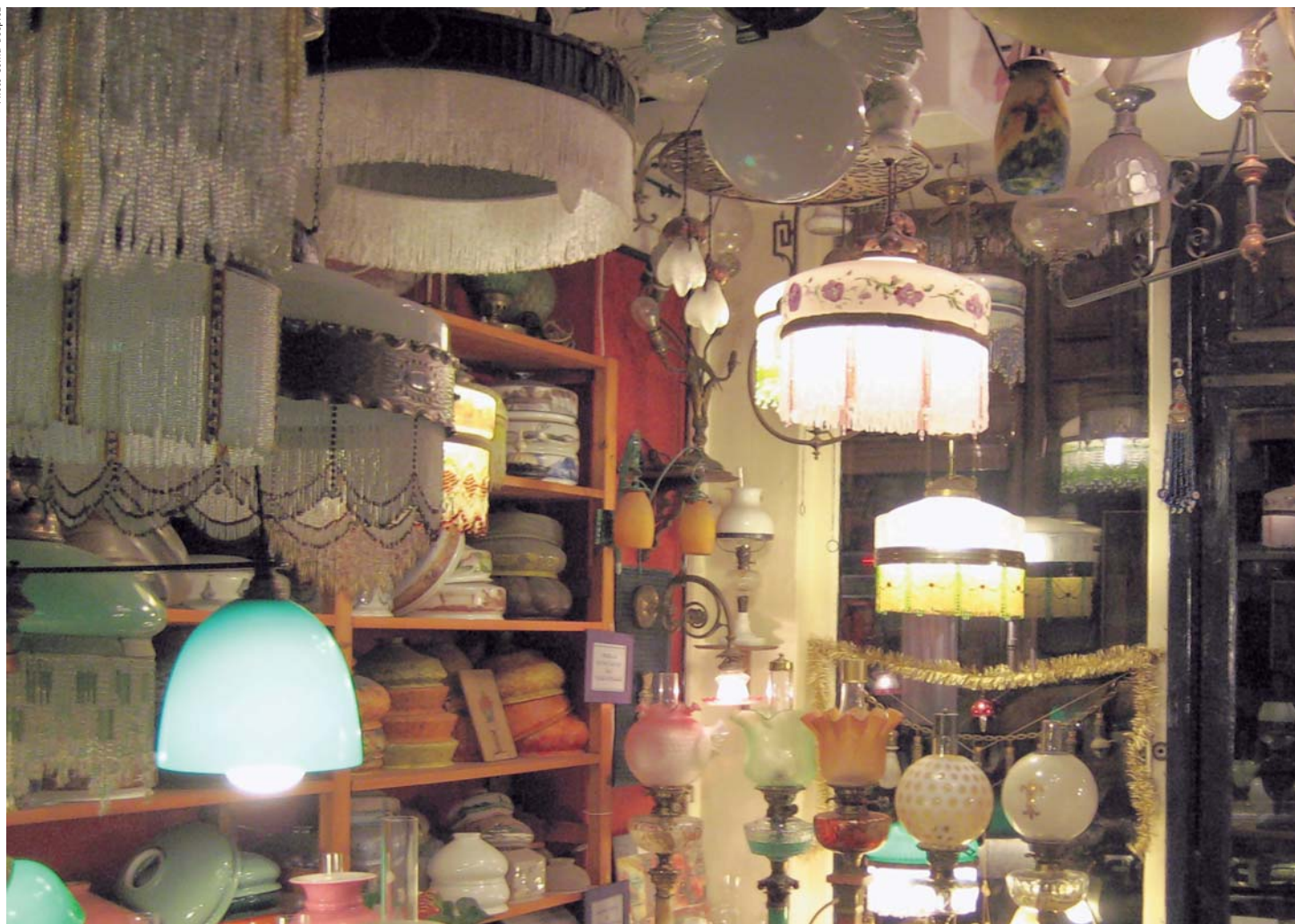
L'antre extraordinaire de M. Ara, rempli de lampes anciennes que le maître des lieux collectionne.

Il est des lieux extraordinaires, qui plongent celui qui en pousse la porte dans un univers d'un autre temps, où l'histoire flirte avec une poésie séculaire. Lumière de l'œil est de ceux-là. Petite boutique de luminaires anciens nichée dans une obscure rue qui jouxte les Gobelins, cet endroit recèle, tout simplement, un petit morceau du patrimoine mondial.