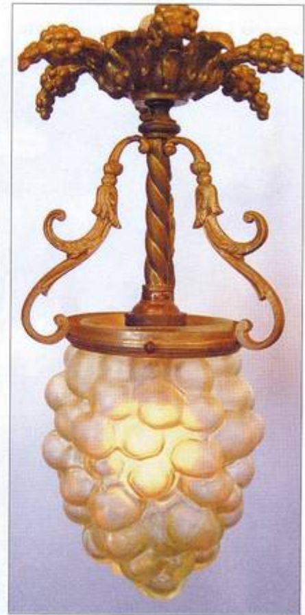
Plafonnier grappe. Laiton, verre.

devait encore conquérir son public». Les matériaux nobles sont également plus cotés que les ersatz et autres substituts : une figurine en laiton sera vendue sous le nom de bronze à un prix élevé alors qu'un objet comparable en régule (alliage de zinc) ne reste qu'un pauvre objet... Même chose pour le cristal au plomb, plus cher que le verre ordinaire, ou le verre soufflé et modelé manuellement, comparé au verre moulé... ■