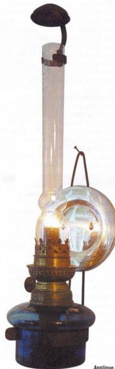
Applique murale de cuisine à bec et verre rare. Verre et laiton.

Les fabricants les plus prestigieux de lampes étaient concentrés dans six pays : la France, la Belgique, l'Allemagne,