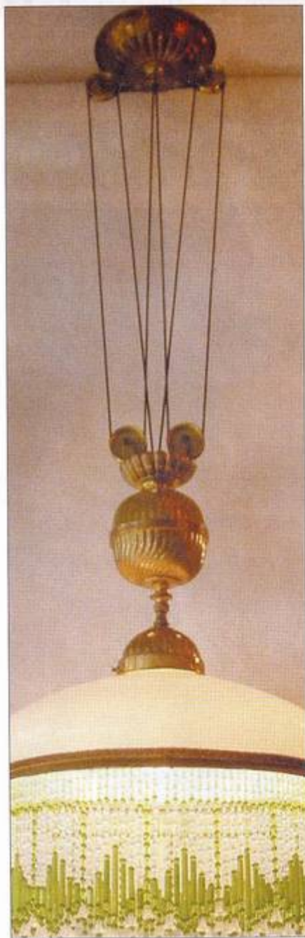
Monte-et-baisse avec abat-jour en verre opale. La frange est de type Bohème (majorité de grosses perles). Verre, laiton. Env. 1910. Art Nouveau.