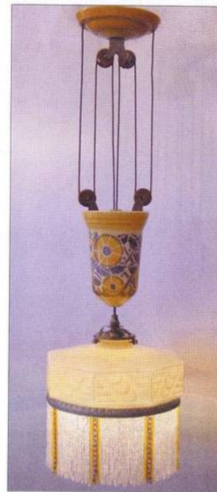
Monte-et-baisse avec abat-jour moulé, décor du contre-poids au pochoir. Faïence, verre. Env. 1930.